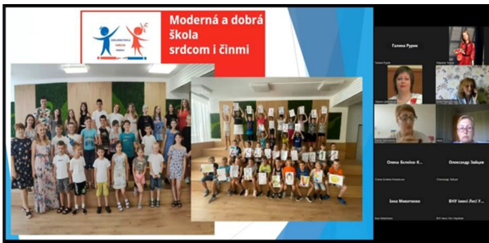
Інформація кафедри соціальної роботи і соціальної педагогіки

Загальні питання: centr@khnmu.edu.ua Публікація матеріалів: press@khnmu.edu.ua